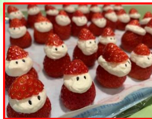
12月 クリスマスビュッフェ